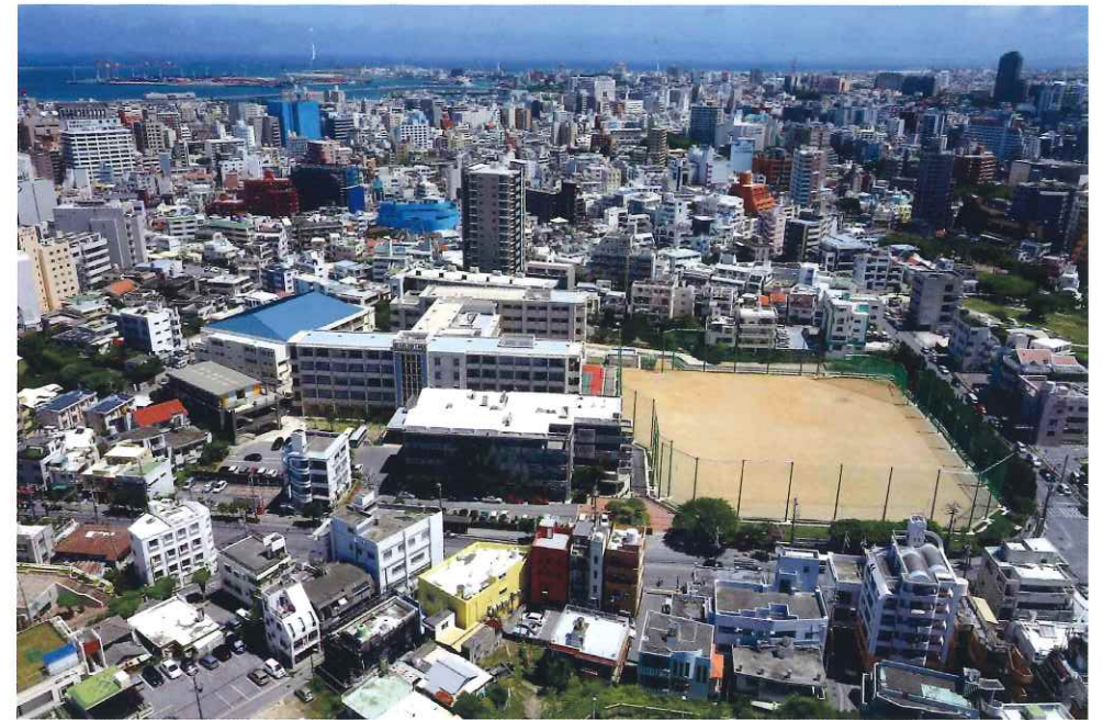
2015年 運動場竣工(7375)