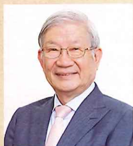
記念講演講師 いおきべまこと 五百旗頭 真氏 国際政治学者・ 兵庫県立大学理事長