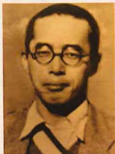
しまだ あきら 島田 叡氏

明治34年(1901年)12月25日、兵庫県神戸市須磨区に生まれる。 昭和20年1月、最後の官選知事として、米軍上陸が間近に迫る 沖縄県に赴任。常に沖縄県民に寄り添い、食糧の調達や県民の疎 開などに尽力し、同年6月、糸満市の摩文仁の丘で消息を絶った。 戦後、「沖縄の島守」と称され、今なお多くの人々に慕われ続け ている。