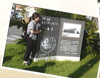
新温泉町での交流活動