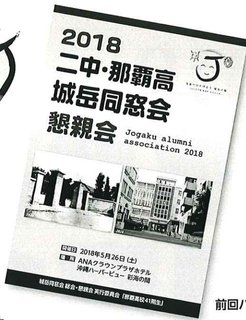
前回パンフレット