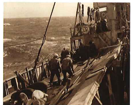
太平洋上の豚と豚小屋