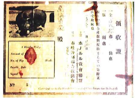
豚購入募金の領収証（1948年、ハワイ）